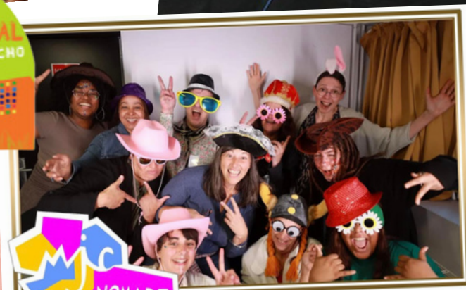
Centre social NOMADE Fête ses 10 ans